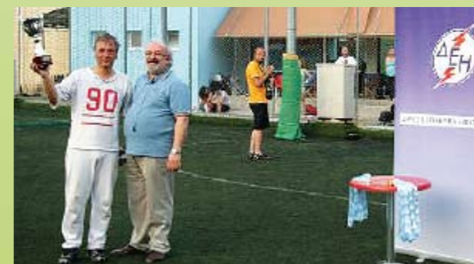
Η στιγμή της απονομής του βαρύτιμου τροπαίου.

Κατά κοινή ομολογία, η διοργάνωση του τουρνουά ήταν άριστη, με πολύ καλή υποστήριξη και με ένα εξαιρετικό μπουφέ το βράδυ της Κυριακής! Όλοι οι συμμετέχοντες (που για μερικές ώρες έγιναν αντίπαλοι και στον αγωνιστικό χώρο, πέραν του επαγγελματικού) ανανέωσαν το ραντεβού τους για την επόμενη χρονιά για να ανταλλάξουν πάσες, μαρκαρίσματα, τάκλιν, επιχειρηματικές πληροφορίες και ΜW! Οι διαρρέουσες πληροφορίες ότι στο νικητή του επόμενου τουρνουά θα δοθεί Άδεια Παραγωγής 100MW ελέγχονται ως ανακριβείς!