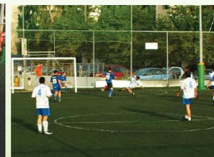
Το δεύτερο γκολ της ΕΛΙΚΑ στον μικρό τελικό.