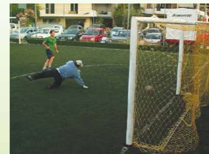
Το νικητήριο γκολ της ΜΠΕΝΕΡ στον μεγάλο τελικό.

Για την ιστορία, πρωταθλήτρια αναδείχτηκε η ομάδα της ΜΠΕΝΕΡ [2 - 1 το σκορ του μεγάλου τελικού και 4 - 1 το σκορ του μικρού τελικού].