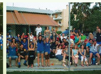
Η ενθουσιώδης εξέδρα.

Κατά τη διάρκεια του αγωνιστικού διήμερου κυριάρχησαν τα συνθήματα: • είναι τρέλα, είναι τρέλα - του αιολικού η άσπρη η νασέλα! • Αίολε φύσηξε σε παρακαλώ - ενέργεια να βγάλουμε από το αιολικό! • παίξτε τώρα για τη μεγαβατώρα!